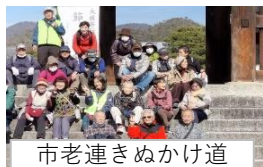
市老連きぬかけ道