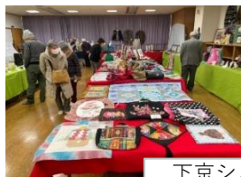
下京シルバー作品展