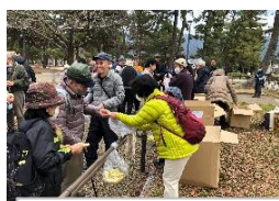
お年玉プレゼント