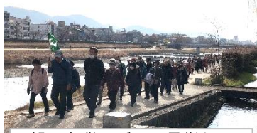
朝日を背にゴール目指して