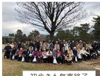
初歩きも無事終了