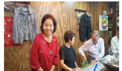
べっぴんのママさん